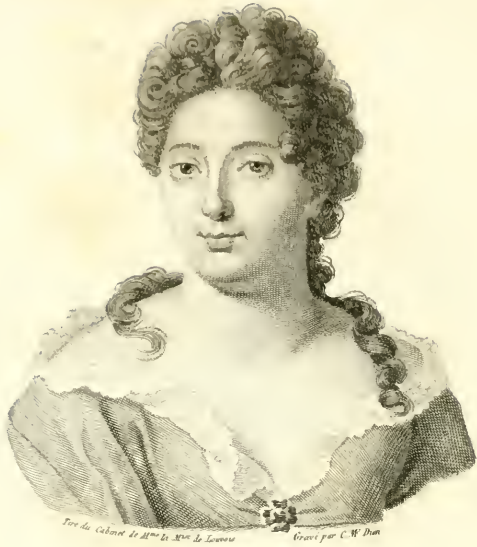
ANNE DE SOUVRÉ, M is E DE LOUVOIS.